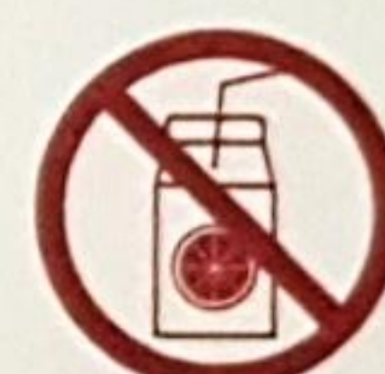
Succhi di frutta arricchiti

Dovrebbe parlare con il suo medico se ha qualsiasi dubbio sulla terapia con eltrombopag